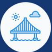
ДОБРА ОД ОПШТЕГ ИНТЕРЕСА