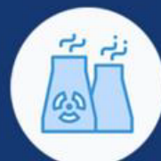
УПРАВЉАЊЕ НУКЛЕАРНИМ ОБЈЕКТИМА