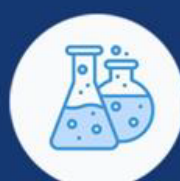
ПРОИЗВОЂА И СНАБДЕВАЊЕ ХЕМИКАЛИЈАМА