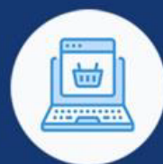
ИНФОРМАЦИОНО ДРУШТВО ЕЛЕКТРОНСКА ТРГОВИНА